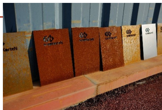
Echantillons de tôle corten en cours d'oxydation