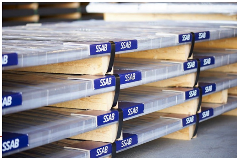
Tôle brute telle que stockée en entrepôt